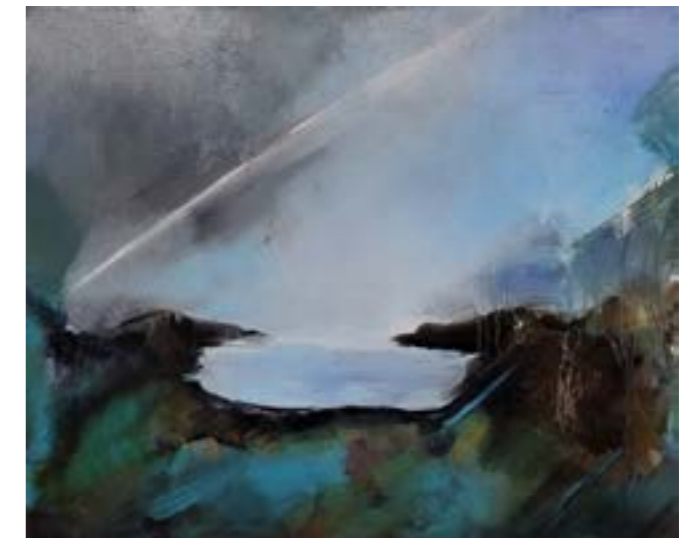
af Susanne Fendt