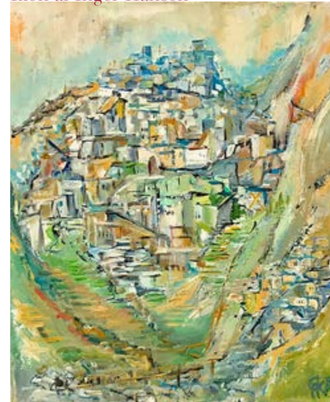
af Carsten Filberth