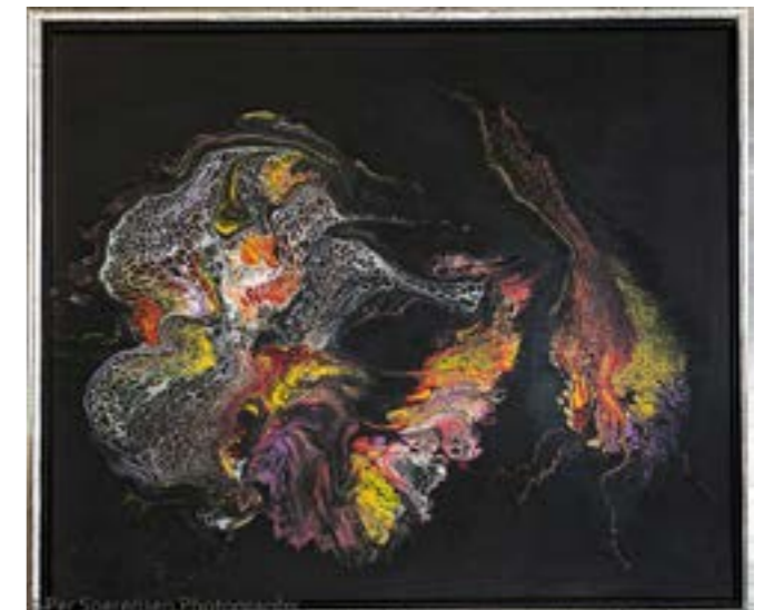
af Per Sørensen