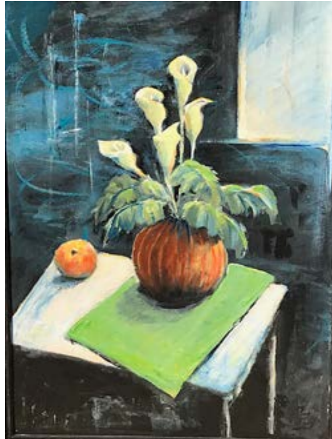
af Margit Hagemann